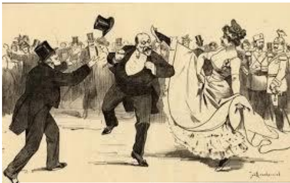
Le Prince de Galles à Paris

Actuellement F-GB en T. compte 130 membres, dont 20% de Britanniques. Dans les années 1985-90, il n'y avait pas un seul Britannique ; c'est à partir de 1995 que les premiers nous ont rejoints. Les activités ont pour but de permettre une meilleure compréhension entre nos deux peuples et de renforcer les liens qui unissent nos deux pays, la France et la Grande Bretagne. C'est ainsi que nous organisons des événements, conférences, concerts, rencontres et discussions dont les thèmes sont franco-britanniques.