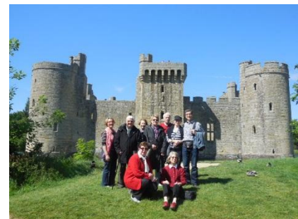
Devant le Château de Bodiam