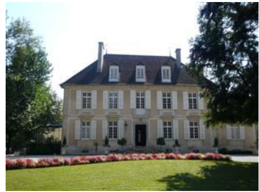
Le Château de Rigny