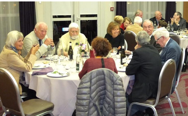
Même les histoires tristes finissent bien à FGB There is always a happy ending after a FGB conference