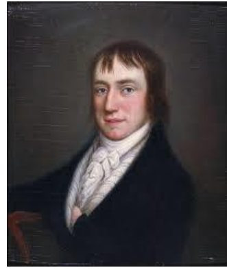
Un jeune poète séduisant William Wordsworth as a young man

William Wordsworth's sentimental journey in the Loire valley